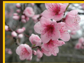
Fleurs de Prunus serrulata