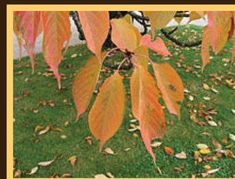
Prunus Serrulata («finement dentelé» en latin) doit son nom au contour de ses feuilles.

LES JAPONAIS CÉLÈBRENT LA FLORAI- SON DE CET ARBRE EN AVRIL, LORS DE MANIFESTATIONS APPELÉES HUNAMI OU OHANAMI !