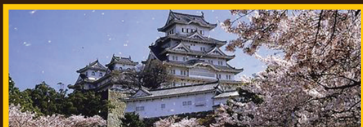
Hanami au pied du château de Himeji

Pour les chinois et les japonais, les fleurs correspondent à des saisons et possèdent toutes des symboliques particulières. Le cerisier 'sakuna' est aussi la fleur du printemps et la fleur est un symbole de renaissance après l'hiver et autrefois, le calendrier lunaire faisait débiter l'année au printemps.